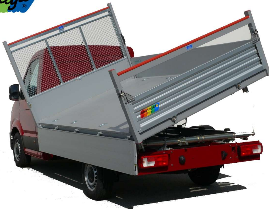
Illustrazione a solo scopo informativo - Non contrattuale