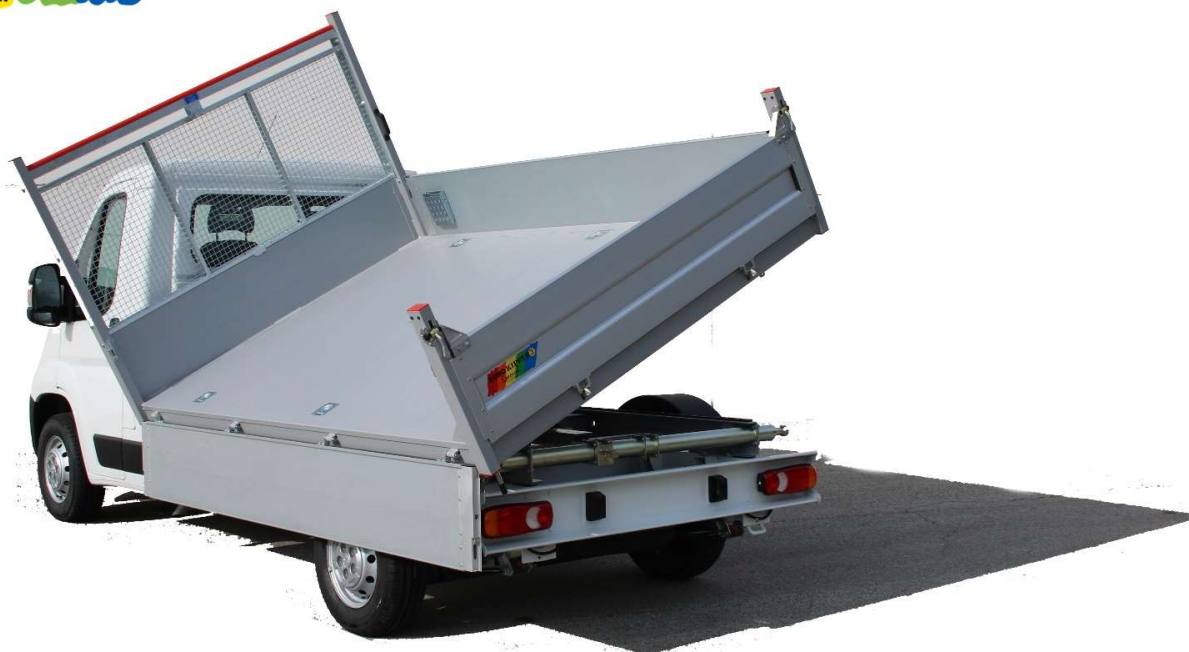
Illustrazione a solo scopo informativo - Non contrattuale