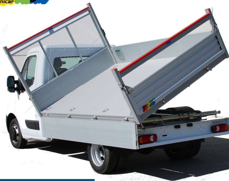
Illustrazione a solo scopo informativo - Non contrattuale