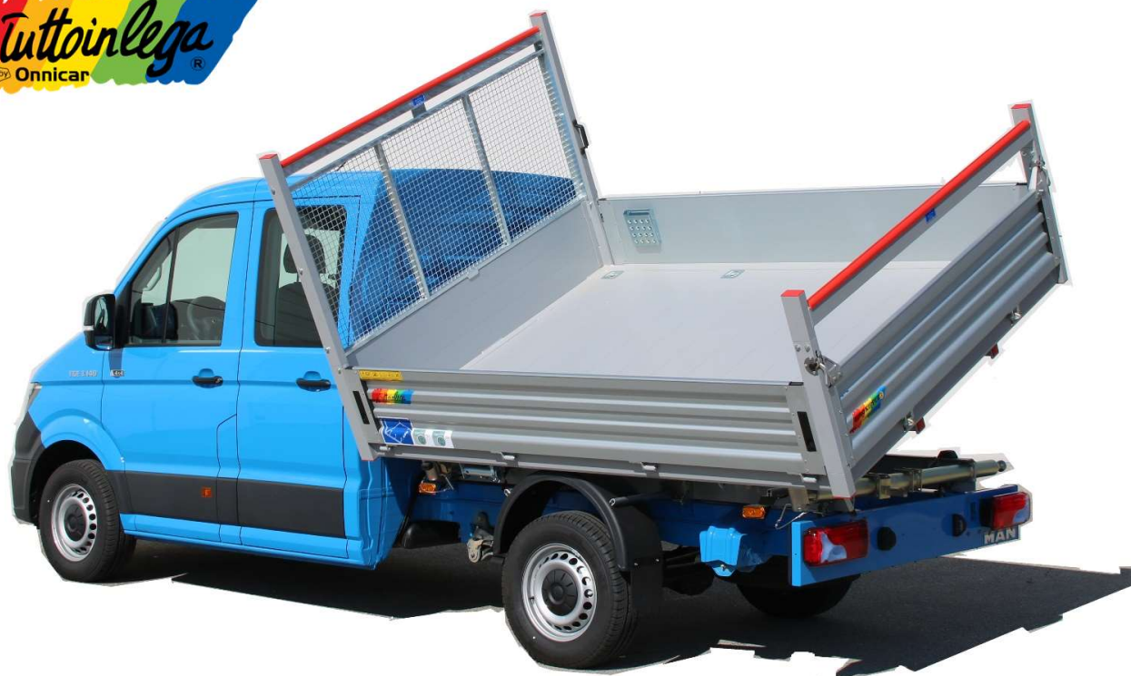
Illustrazione a solo scopo informativo - Non contrattuale